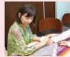
迫さんの奥様であるミレイさんにより、一人ずつEAV測定が行われました。手の指にある7ヶ所のツボを測定した数値によって、人やモノとの相性がわかります。

迫さんの言葉に、終始頷いて聞いていたお二人。お母さんの感想は、「どれもおっしゃる通りで、測定の数値だけでどうしてわかるのか不思議でした」とのことでした。